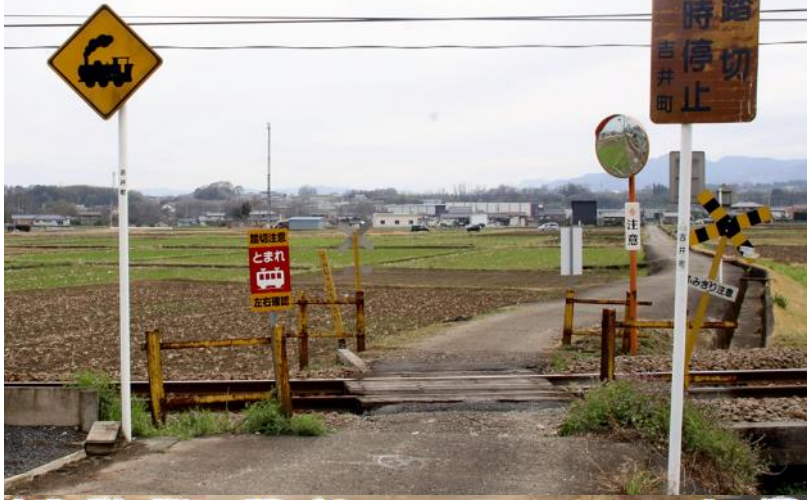
事故が起きた群馬県高崎市の踏切